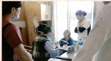
巡回で患者に話しかける職員

当院は言語聴覚士が不在のため、このプロジェクトを活用し、食べることが困難な方への支援につなげていきたいと思っております。