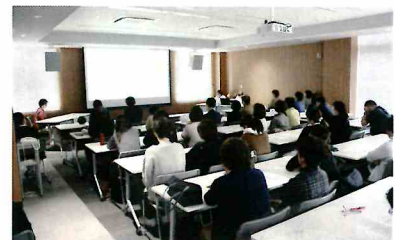
当院3階の大会議室で行いました