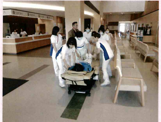
1階 待ち合いロビーでの訓練の様子

平成29年11月2日、新病院で初めての避難訓練を行いました。火災発生通報、初期消火、患者さんの避難の補助や安全場所へのベッド移動などを行い、病院施設内の防災各種機器の設置場所、作動方法、避難経路の確認をかねて実施しました。