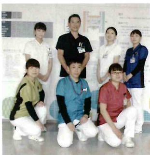
新しくなったユニフォーム

医師は濃紺色、看護師は白色、薬剤師は水色、診療放射線技師、臨床検査技師は紺色、理学療法士、作業療法士は濃い桃色、管理栄養士、歯科衛生士は黄緑色、看護補助者は白衣に薄い緑色が入った上着となっています。