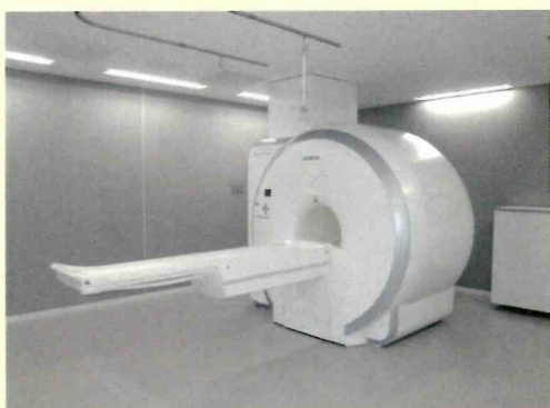
1.5テスラMRI装置 【ドイツ・シーメンス社製 MAGNETOM ESSENZA 1.5T】

CT装置も新しくなり、地域住民の皆さまに安心して受診していただけるように努めてまいります。ご不明な点などがございましたらお気軽に各診療科までご相談ください。