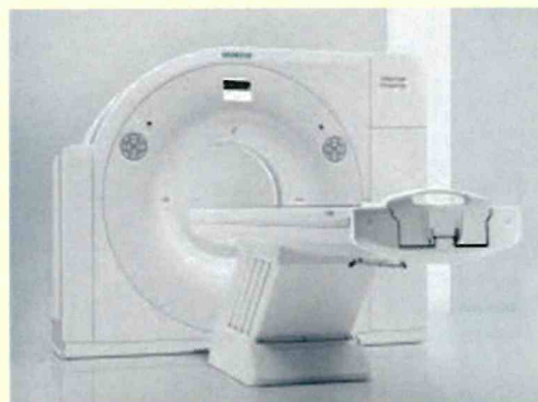
64スライスCT装置 【ドイツ・シーメンス社製 SOMATOM Perspective】