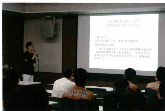
宝達志水病院で行われた症例検討会

初めに、宝達志水消防署員から平成29年度の救急搬送数などの報告を受けたあと、「胸部外傷(胸痛)患者の観察について」「ビニールハウス倒壊による外傷性窒息症例」「上部消化管出血により転院搬送に至った症例」の発表がありました。