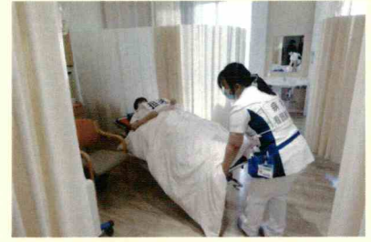
避難誘導訓練の様子

今後も訓練を通して防災意識を高めるとともに、患者さんの安全確保に努めていきます。