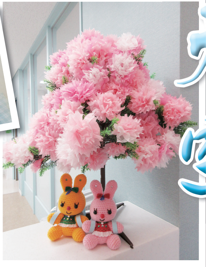
スタッフ手作りの桜でお花見気分♪